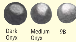
Dark Onyx Medium Onyx 9B